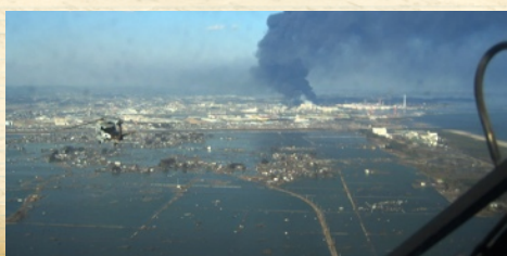
Wo vorher Häuser standen: nur noch Wasser

Diesen Advent haben wir persönlich als sehr intensiv und bereichernd erlebt. Zum einen weil hier in der Gemeinde viel passiert ist, dazu später. Zum anderen weil es dieses Jahr durch die Ereignisse des 11.3. mit den Bildern der riesen Zerstörung im Hinterkopf - Erdbeben, Tsunami und Supergau - besonders eindrücklich war wie sehr sich doch die gesamte Schöpfung in „Geburtschmerzen“ windet und sich nach der zweiten Ankunft dessen sehnt, der alles neu machen wird: Jesus Christus! Auch weil wir